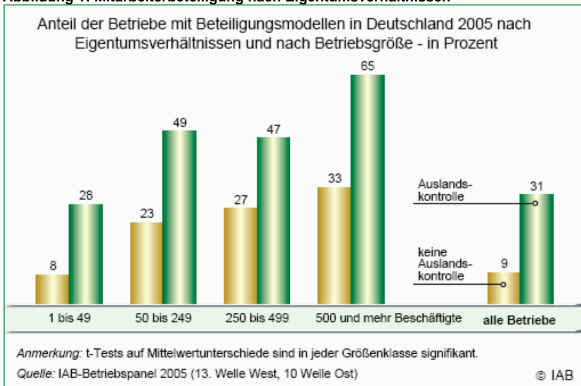
Abbildung 1: Mitarbeiterbeteiligung nach Eigentumsverhältnissen